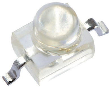
Subminiature Solid State Lamps Gull Wing Lead