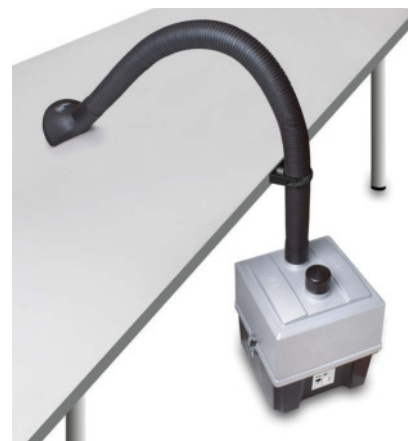
> Unità Zero Smog EL