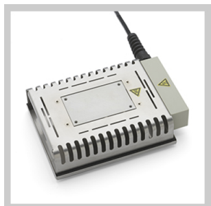
Piastre di preriscaldamento