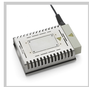
Piastre di preriscaldamento