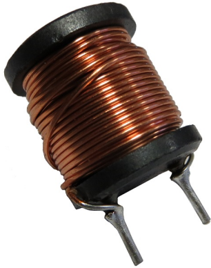
DIMENSIONS (UNIT : mm)